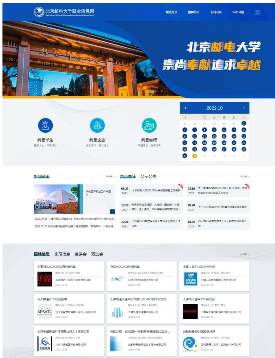
图 8：就业信息网界面

2021 年学校毕业生共计 6897 人。其中，本科生占毕业生总数的 50.98%，硕士生占 45.02%，博士生占 4.00%。