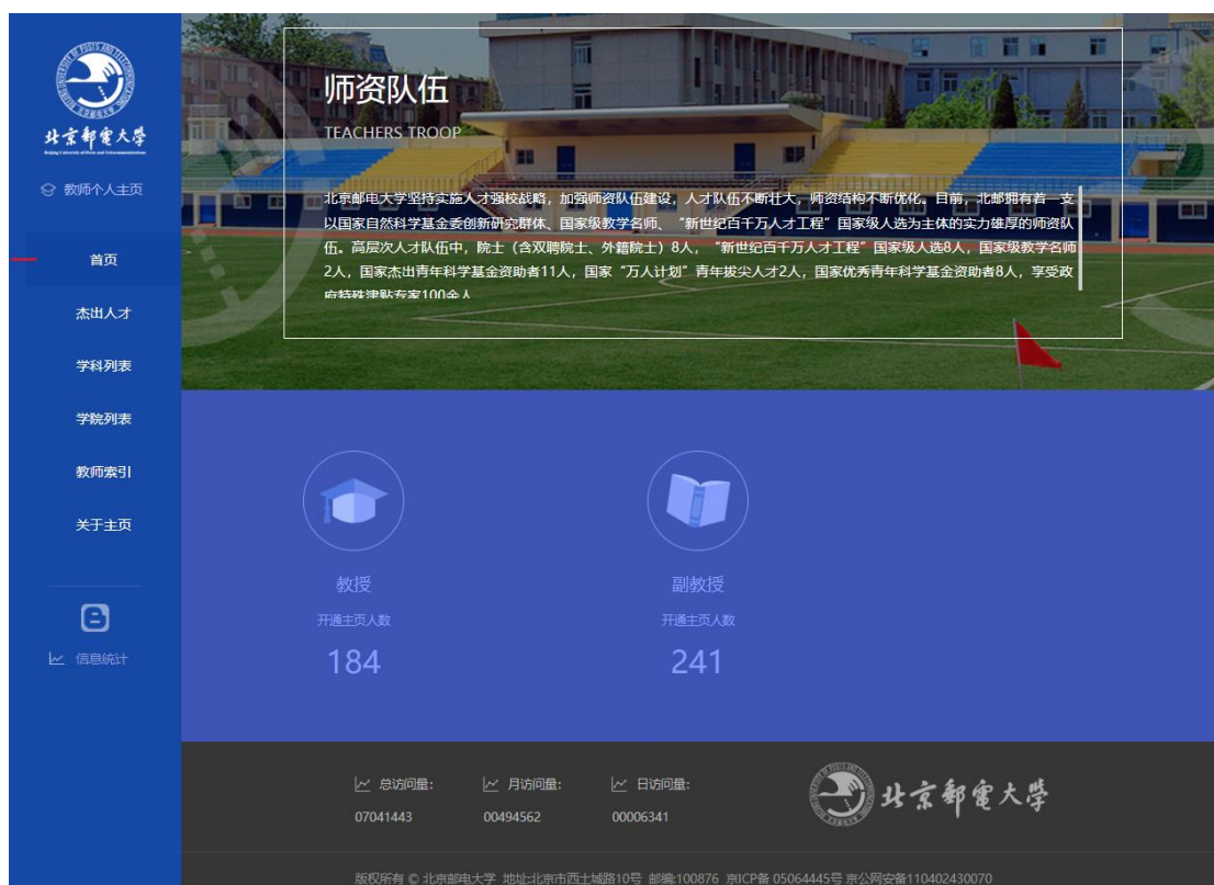
图 7: 校主页“人才招聘”专栏界面

着眼于教职员工需求和学校发展需要，通过多种渠道主动向校内和社会公开人事信息，为学校深化人事改革、加强人才队伍和干部队伍建设提供有力支撑。不断健全人事信息公开机制、梳理信息公开范围、提高信息公开时效，扎实做好各项工作，使学校人事信息公开工作稳中有进，取得了一定成效。积极拓展发布渠道，通过加强网站建设、修订教师手册、编写新任教职工岗前培训手册等方式，切实推进人事信息公开工作。对学校主页中校领导的相关信息进行更新，增加兼职情况。在学校主页“学在北邮”页面设置“教师主页”，对学校师资队伍建设情况进行全面介绍，开通教师主页教授 184 人、副教授 241 人。