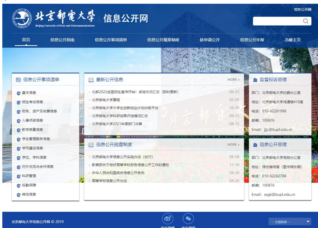
图 1：学校信息公开网站界面

北京邮电大学根据《教育部办公厅关于做好2022年高校信息公开年度报告工作的通知》要求，结合2021-2022学年学校信息公开工作的具体开展执行情况，编制北京邮电大学本学年信息公开年度报告。报告内容包括：概述，主动公开信息情况，依申请公开和不予公开情况，对信息公开的评议情况，因信息公开工作遭到举报、复议、诉讼的情况，信息公开工作的经验、问题和改进措施，其他需要报告的事宜以及信息公开事项清单具体网址的附件材料等。本学年报告中统计数据的时间为2021年9月1日至2022年8月31日。