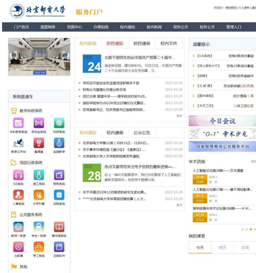
图 4：校内门户网站界面