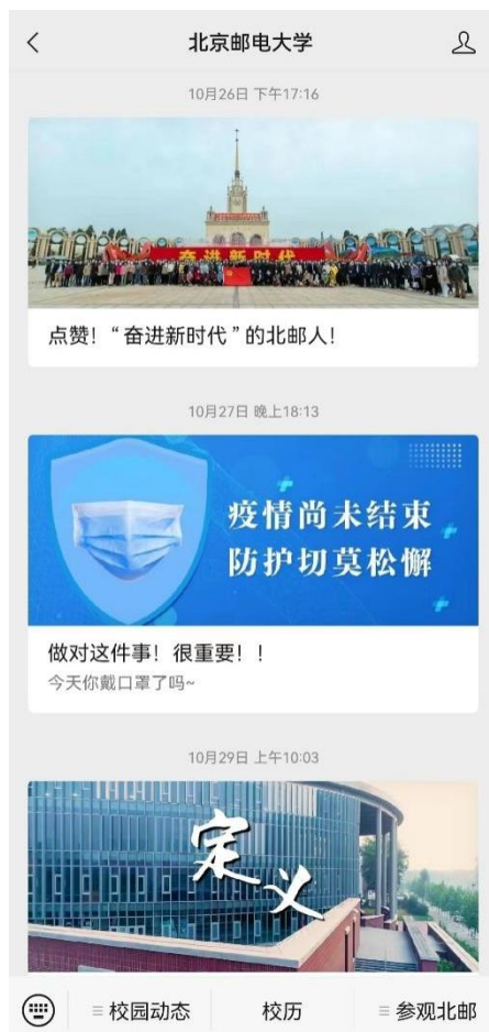
图 5: 北京邮电大学官方微信公众账号界面