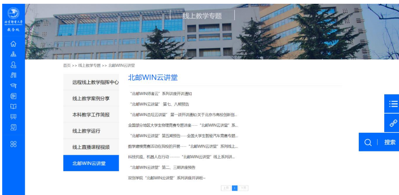
图 9：“在线开放课程情况”专栏使用查询功能

同时，教师采用多平台混合式教学，教学组合方式主要有：爱课堂+QQ 群、爱课堂+课堂派、爱课堂+雨课堂、课堂派+微信群、腾讯课堂+QQ 群、腾讯课堂+爱课堂、B 站直播+QQ 群、雨课堂+QQ 群、雨课堂+腾讯会议、雨课堂+腾讯课堂等形式。调查显示，学生与教师均青睐的教学平台有腾讯课堂、腾讯会议、爱课堂、QQ 直播或微信直播。